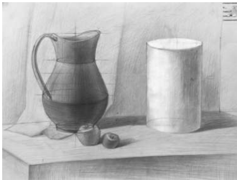
Рисунок 1.1 Пример работы по вступительному испытанию «Рисунок»

предметов с учетом линейной перспективы, точно передать взаимное расположение предметов в пространстве, верно определить их пропорции, передать характер, форму, объем, текстуру и материальность предметов и драпировки в постановке с помощью тонального рисунка, выполненного штрихом, передать светотеневые отношения, плановость пространства натюрморта.