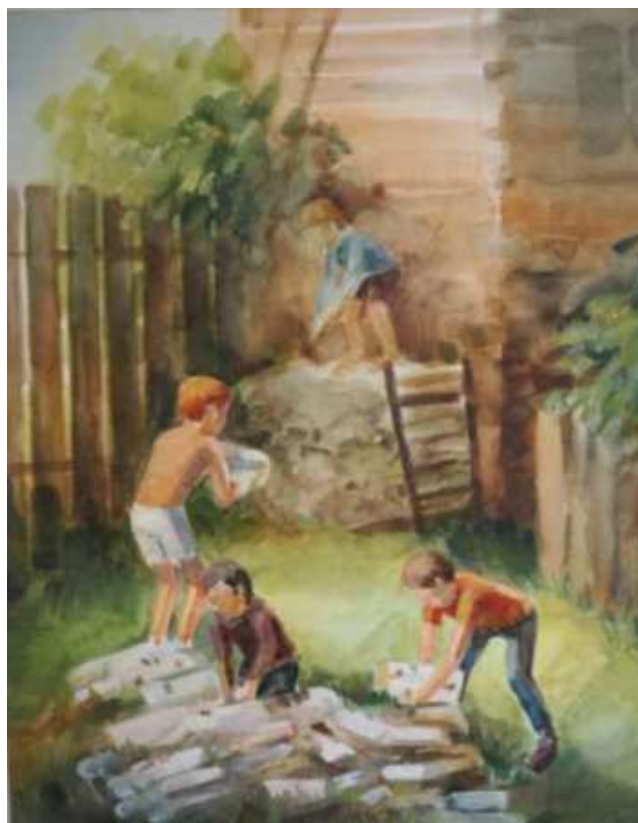
Рисунок 3.3 Пример работы по вступительному испытанию «Композиция»