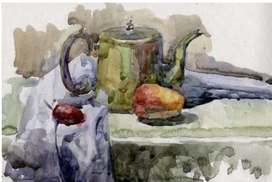
Рисунок 2.1 Пример работы по вступительному испытанию «Живопись»

Предъявляемые требования: Поступающий должен скомпоновать на листе бумаги рисунок натюрморта, точно передать взаимное расположение предметов, правильно определить их пропорции, верно передать характер, форму, материальность, цветовые и тональные отношения изображаемых предметов в пространстве в условиях дневного освещения.