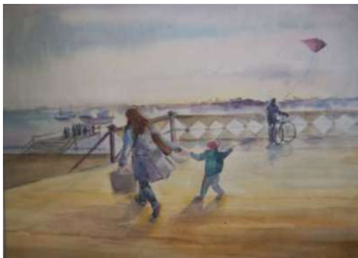
Рисунок 3.1 Пример работы по вступительному испытанию «Композиция»

Предъявляемые требования: Поступающий должен выполнить эскиз композиции, в котором должна прочитываться тема, сюжет, композиционный центр. Примерные темы композиций: «Спорт», «Труд», «Каникулы», «Лето», «Музыка» и пр. Тема, по которой выполняется экзаменационный эскиз композиции, озвучивается в день экзамена.