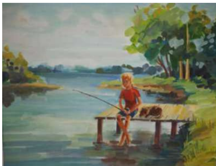
Рисунок 3.2 Пример работы по вступительному испытанию «Композиция»