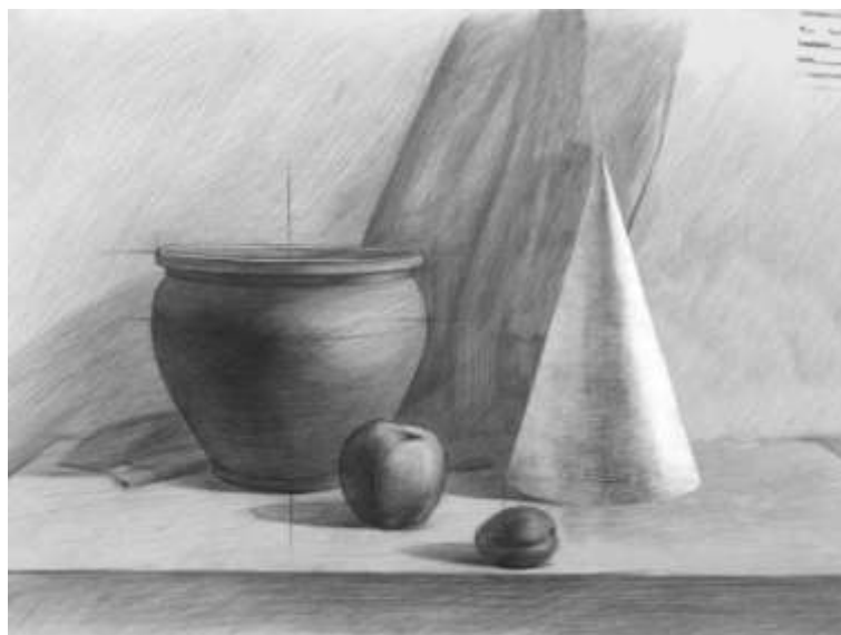
Рисунок 1.2 Пример работы по вступительному испытанию «Рисунок»