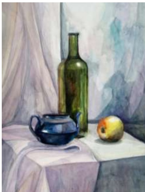
Рисунок 2.3 Пример работы по вступительному испытанию «Живопись»