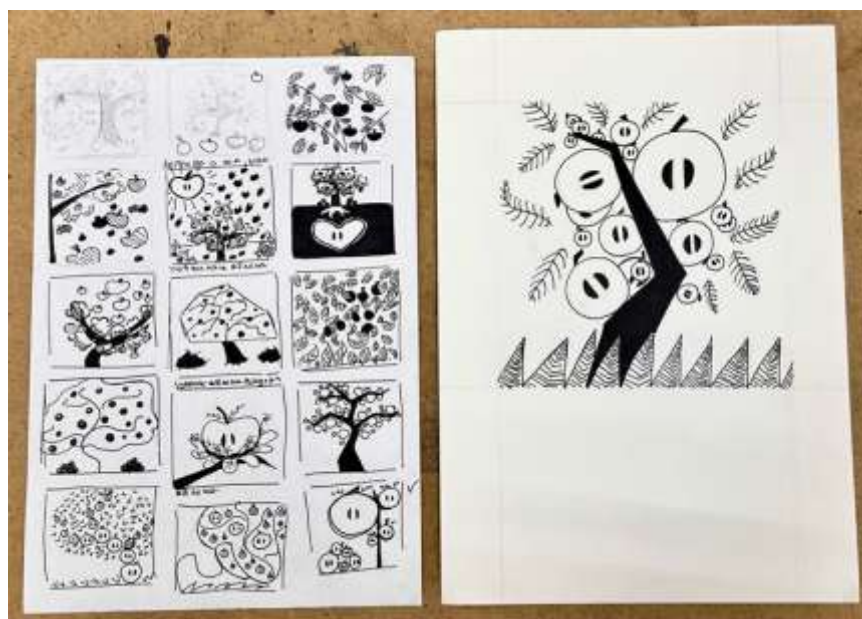
Рисунок 3.5 Примерный ход работы над заданием