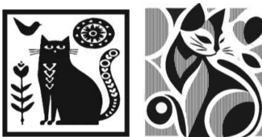
Рисунки 3.1, 3.2 Примеры работ по вступительному испытанию «Стилизованная композиция»

Экзаменаторы рассматривают и проверяют не только итоговую композицию (на листе плотной бумаги, гелевой ручкой), но и черновые материалы: эскизы и варианты, этапы работы над итоговой компоновкой, сделанные простым карандашом/ручкой в уменьшенном формате на листах для черновиков. В этих эскизах абитуриенту следует проявить оригинальность мышления и нестандартность подхода к выполнению задания, это является одним из критериев оценки работы.