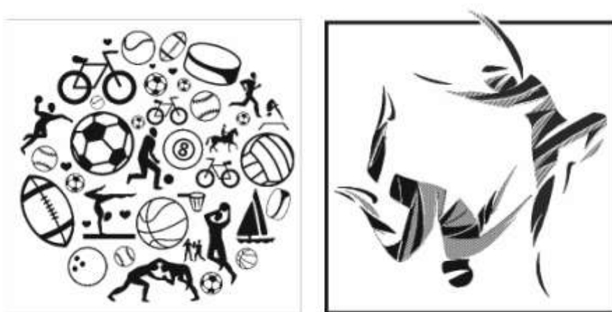
Рисунки 3.3, 3.4 Примеры стилизации к вступительному испытанию «Стилизованная композиция»