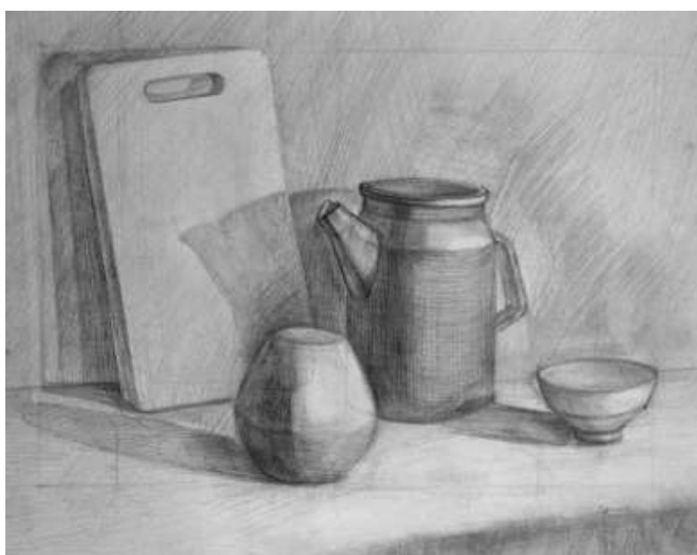
Рисунок 1.2 Пример работы по вступительному испытанию «Рисунок»