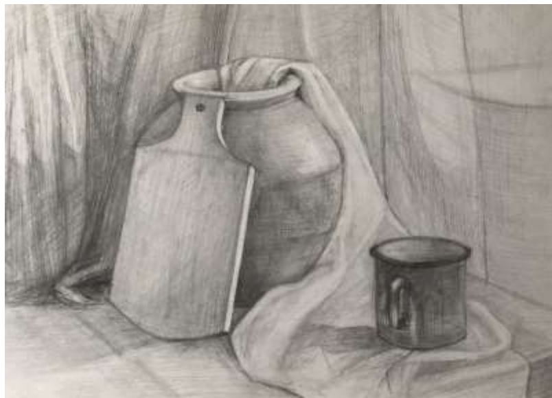
Рисунок 1.1 Пример работы по вступительному испытанию «Рисунок»