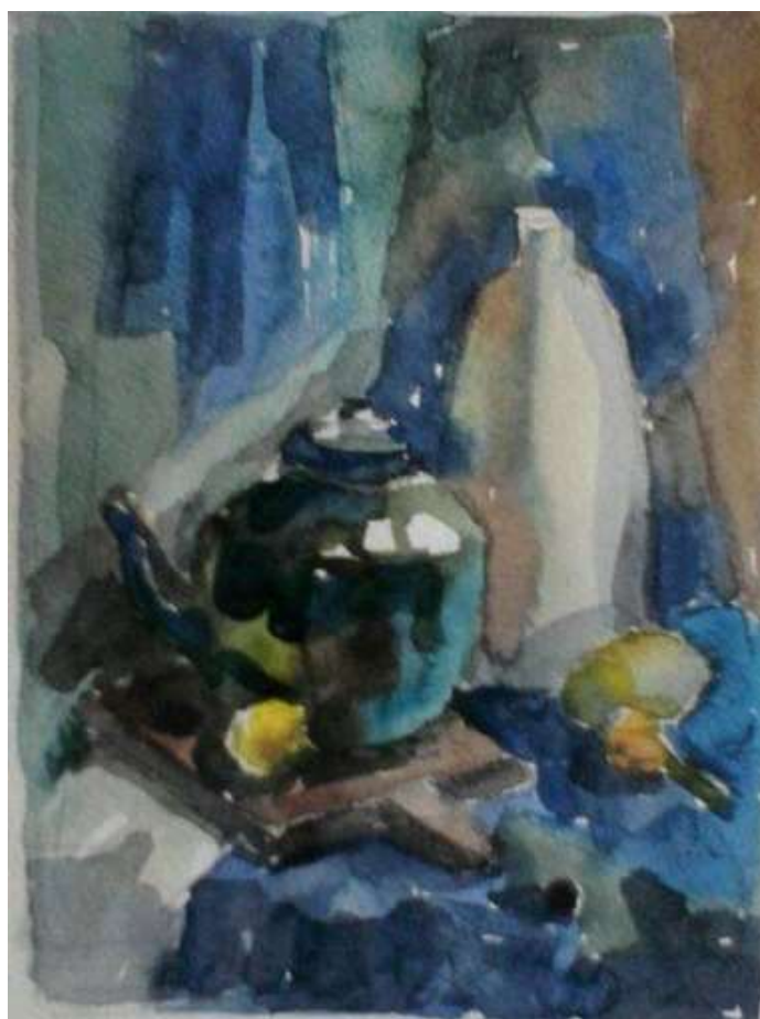
Рисунок 2.1 Пример работы по вступительному испытанию «Живопись»

Время выполнения: 5 академических часов.