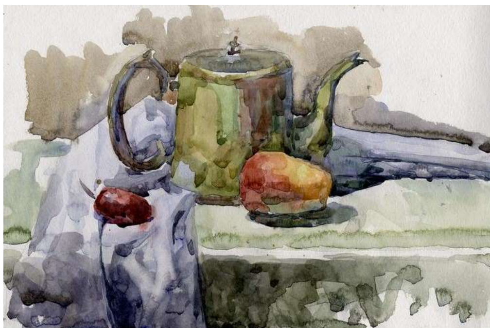
Рисунок 2.2 Пример работы по вступительному испытанию «Живопись»